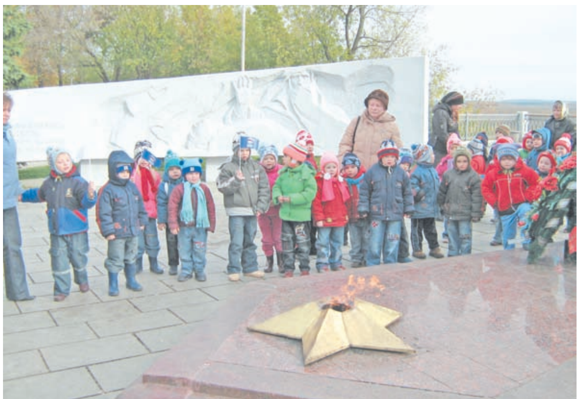
Акция «Открытые сердца»

В рамках акции «Песочница», организованной Кировским региональным отделением партии «Единая Россия» совместно с Управлением образования