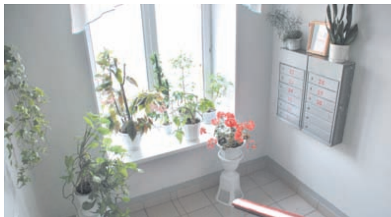
В подъездах дома по ул. Герцена, 45 можно ходить в тапочках