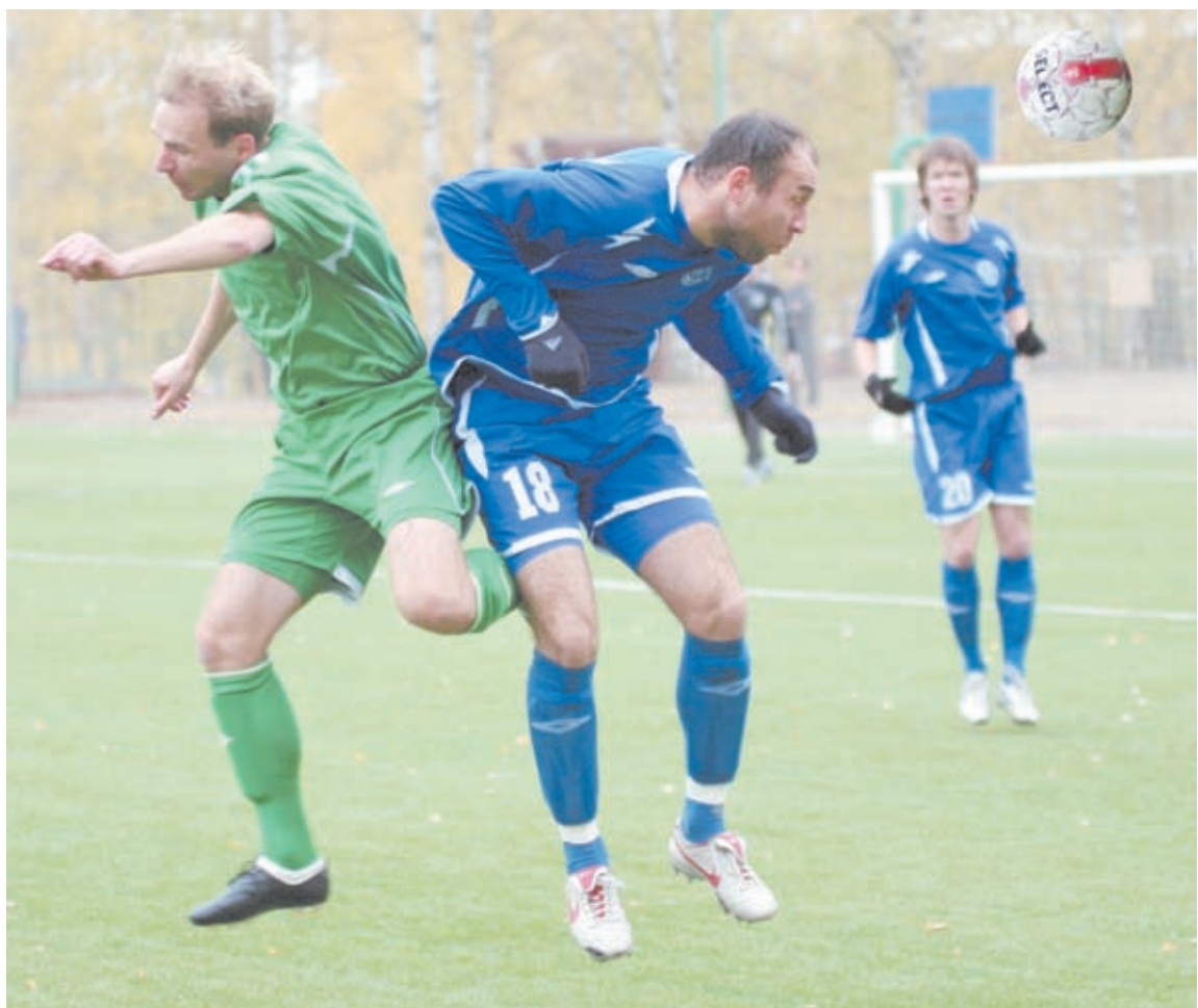
Домашняя встреча 1 октября с «Союзом-Газпром» закончилась поражением со счетом 1:2

Кировские футболисты старались как могли. Они действительно рвались к воротам нижнекамской команды до последнего. К этому можно добавить, что тренерский штаб «Динамо» усилил линию нападения, выпустив на замену еще двух форвардов вместо